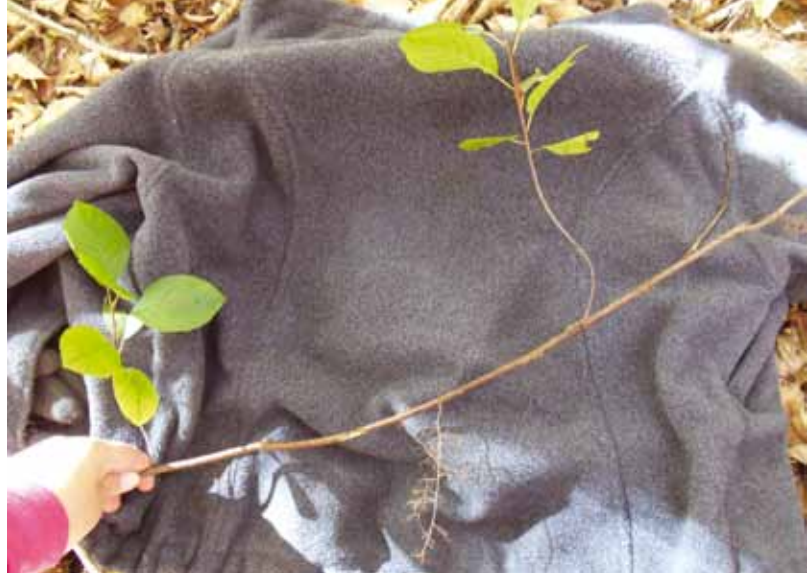
Le marcottage, un moyen de multiplication végétative du nerprun bourdaine.

Les résultats obtenus révèlent une grande variabilité au niveau des caractéristiques des différents sites. Par exemple, les sites se situaient entre 165 et 367 m d'altitude, pouvaient contenir jusqu'à 43 espèces de plantes herbacées ou d'arbustes et affichaient des valeurs de pH entre 3,6 et 6,5. De plus, sur les 30 parcelles, 15 espèces d'arbres étaient dominantes en termes de nombre de tiges, celles-ci présentant une