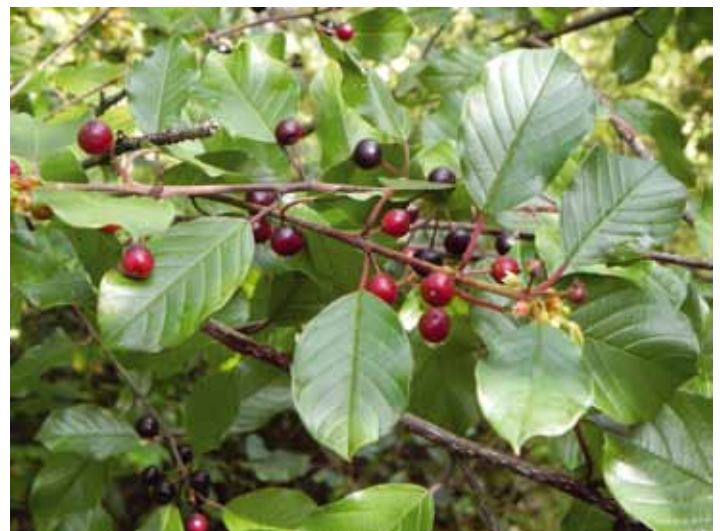
Les rameaux de nerprun bourdaine portent souvent en même temps des fleurs et de nombreux fruits à divers stades de mûrissement.

l'ombre. En comparaison, le nerprun cathartique ( Rhamnus cathartica ), autre envahisseur du même genre, préfère les sols alcalins et il semble très peu tolérant à l'ombre. Ce dernier est très commun dans la plaine