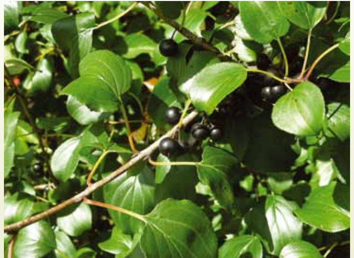
Les feuilles du nerprun cathartique sont à peine plus longues que larges, plus larges à la base qu'au sommet, comptent seulement 3 grosses nervures latérales (de chaque côté de la nervure centrale), et leur marge est dentelée.

du Saint-Laurent, particulièrement sur l'Île de Montréal. Toutefois, le nerprun cathartique n'a été recensé dans aucune des 30 parcelles forestières que nous avons échantillonnées dans les Cantons-de-l'Est.