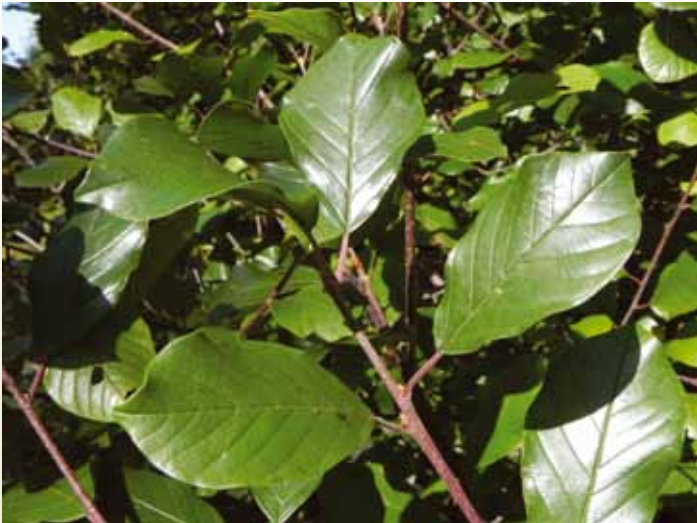
Les feuilles du nerprun bourdaine sont environ deux fois plus longues que larges, plus larges au sommet qu'à la base, comptent au moins 6 grosses nervures latérales (de chaque côté de la nervure centrale), et leur marge est entière.